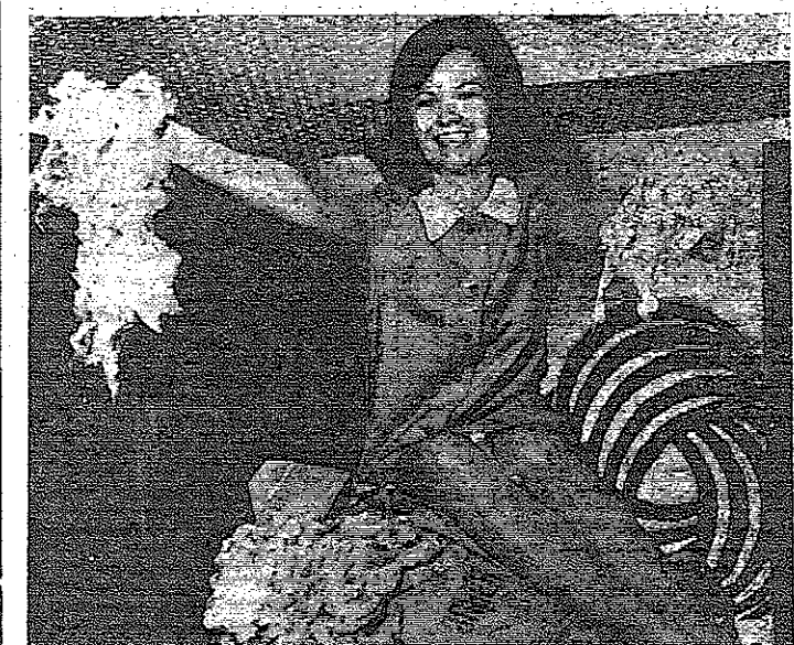
توسلورفا - انما - يسود الفرح الكبير الان في بورصة الصوف بجنينة دولسورث بالمانيا الانتخابية لانهما استطاعت للمرة الاولى التفوق فسي الزيادة التي اجريت في اوستراليا لاسي يسمى بـ «الثلاث الذهبية» التي تحتوي على اعلو وانتم صرف في العالم وقد كانت تغلب على المانيا الانتخابية في هذه الزاوية في سوق الصوف في

وقالت القصة ان قلب نقاب مصنوعة بصورة غير قانونية توزع في اثينا - ويحتج الدولة صنع القالب في اليونان وهناك ثلاث قلب اصحابها تحمل غلاما يشير الى تكري القالب الجيش في